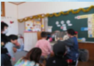
↑大型絵本の読み聞かせ(児童発達支援)

「すぎのこ園」の事業は令和5年3月末で終了し、令和5年4月からは「児童発達支援センターはなわ」とし事業を拡大し新たにスタートします。