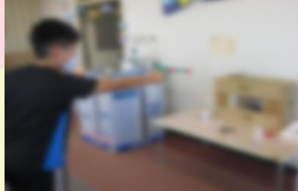
↑縁日遊び(放課後等デイサービス)