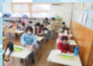
↑製作活動(放課後等デイサービス)