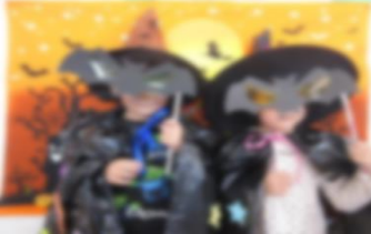
↑ハロウィン(児童発達支援)

「発達支援センターたなぐら」は、児童福祉法に規定された障害児通所支援事業所として指定された、障がいをもつ子どもを対象としたさまざまな活動を行うための事業所です。